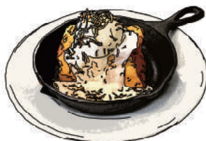
ココナッツ Coconut 1100