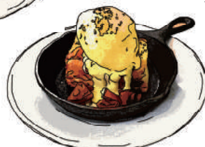
キャラメルリンゴ&カスタード Caramel Apple & Custard 1200