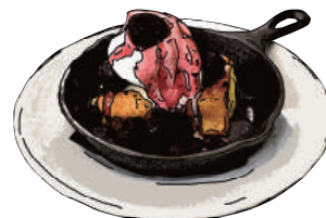
ダークチェリー Dark cherry 1200