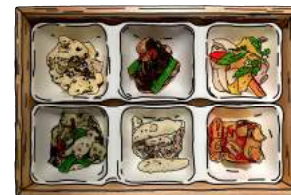
“本日の前菜” 6種 TODAY'S APPETIZER