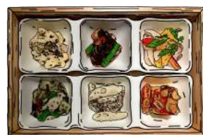
“本日の前菜” 6種 TODAY'S APPETIZER