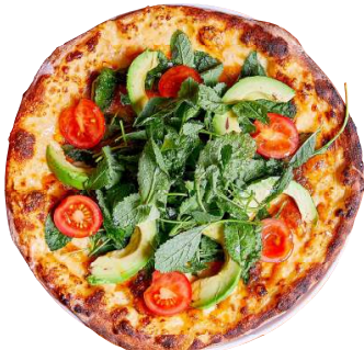
ケールオルトラーナ Kale Ortolana ケール / アボカド / トマト / キャラメルオニオン Kale / Avocado / Tomato / Caramel Onion 1700円