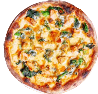
サルモーネ Salmone 菜の花 / サーモン / ボツアルガ Salmon / Canola flower / Bottarga 1600円