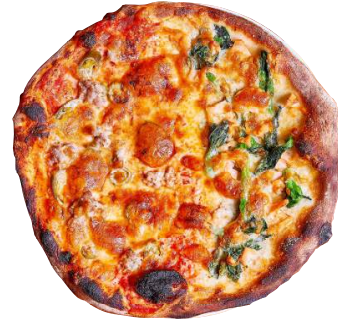
レッド&ホワイト Red & white メキシカンホットとサルモーネの半分&半分 Mexican Hot & Salmone 1600円